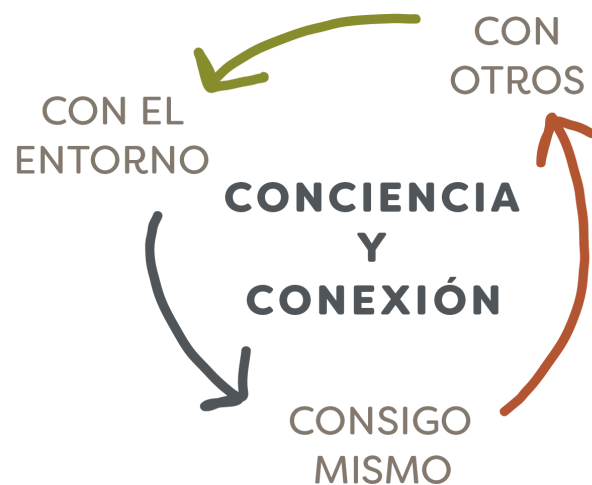
Imagen 1: Espíritu Humboldt

La CONCIENCIA y CONEXIÓN es el sello e hilo conductor que une los valores de este proyecto educativo. La conciencia y conexión se definen en este proyecto como un proceso permanente de mayor conocimiento, comprensión y compasión. El espíritu del Colegio Humboldt se caracteriza por la conciencia y conexión de los miembros que pertenecen a su comunidad: personas altamente conscientes y conectadas consigo mismo y con su espiritualidad; con los demás y con el entorno natural.